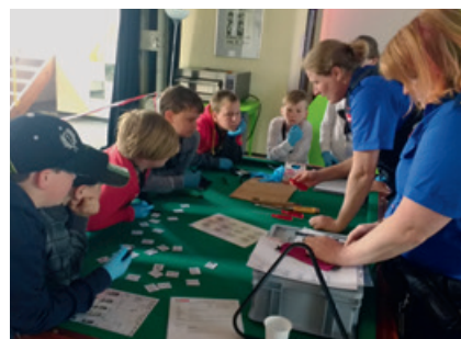
Fingerabdrucktraining mit der Polizei