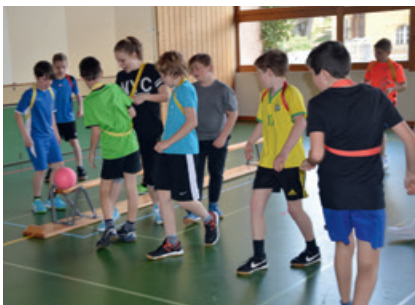
Spiel und Spass in Grünenmatt