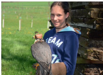
Besuch beim Falkner