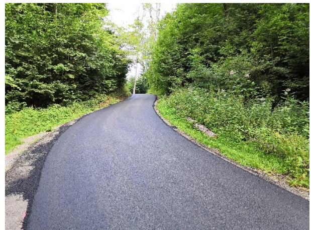
Zufahrt Brandishub nach Belagssanierung

Somit ist noch der Einbau der Fahrspuren aus Ortsbeton bei der Zufahrt Weingarten offen. Die Ausführung dieser Arbeiten ist in der nächsten Zeit vorgesehen, wobei momentan noch kein definitiver Termin besteht. Sobald dieser bekannt ist, werden die betroffenen Anstösser entsprechend informiert werden.